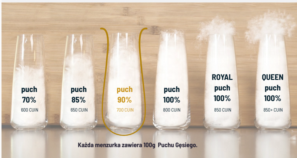
Każda menzurka zawiera 100g Puchu Gęsiego.

System mający na celu uzdatnienie oraz uszlachetnienie puchu - opracowany przez doświadczonych technologów naszej firmy. Jakość i czystość uzyskanego wypełnienia są wielokrotnie wyższe, niż przewidują obowiązujące normy europejskie. Puch zostaje pozbawiony charakterystycznego zapachu, posiada wyższą wyporność i wyjątkową miękkość. Lepsze cechy użytkowe oraz przedłużona trwałość wyrobu gwarantują pełną satysfakcję z użytkowania wyjątkowych produktów AMZ.